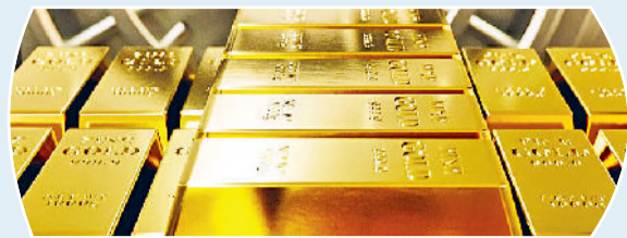
सोना केवल धातु नहीं देश की ताकत : केंद्रीय बैंक के अधिकारी कहते हैं, "सोना केवल धातु नहीं बल्कि देश की ताकत है। देश बनते रहेंगे, बिगड़ते रहेंगे। अर्थव्यवस्था में उतार-चढ़ाव होता रहेगा लेकिन सोना हमेशा अपना मूल्य बनाये रहेगा। 20 जून को समाप्त सप्ताह में स्वर्ण भंडार का मूल्य 57.3 करोड़ डॉलर घटकर 85.74 अरब डॉलर रहा। वहीं विदेशी मुद्रा भंडार इस दौरान 1.01 अरब डॉलर घटकर 697.93 अरब डॉलर रहा।

वृत्त चित्र में दी गयी जानकारी के अनुसार, "आज करेसी नोट की छपाई में इस्तेमाल होने वाली मशीन, इंक से लेकर सभी प्रकार की चीजों का विनिर्माण भारत में ही होता है। उल्लेखनीय है कि पहले, आयातित कागज से नोटों की छपाई होती थी। यह कागज दुनिया की कुछ कंपनियों ही बनाती थीं, जिससे बाजार में इन कंपनियों का दबदबा रहता था और इस कारण बाजार में नकली नोट आने की आशंका बनी रहती थी।