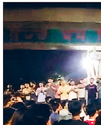
घटना के विरोध में कई जगह हुए प्रदर्शन