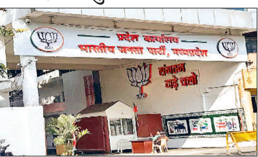
सुनाव का कार्यक्रम का पूरा शेड्यूल घोषित होगा

प्रदेश अध्यक्ष के चुनाव का कार्यक्रम आधिकारिक तौर पर भाजपा के केन्द्रीय चुनाव अधिकारी करते हैं। चुनाव को तारीख एक दो दिनों में जारी हो जाएगा। चुनाव कार्यक्रम में उम्मीदवार के नामांकन दाखिल करने, स्कूटनी और नाम वापसी के साथ ही निर्वाचन की घोषणा का पूरा शेड्यूल घोषित होगा।