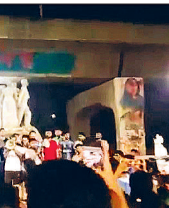
घटना के विरोध में कई जगह हुए प्रदर्शन